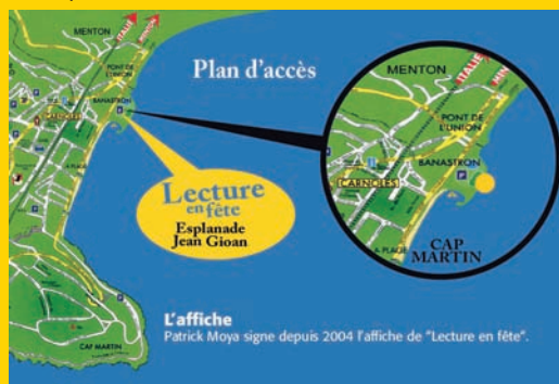
L'affiche Patrick Moya signe depuis 2004 l'affiche de "Lecture en fête".

Accès soumis au port du masque et à la présentation du pass sanitaire selon les règles sanitaires en vigueur au moment de la manifestation.